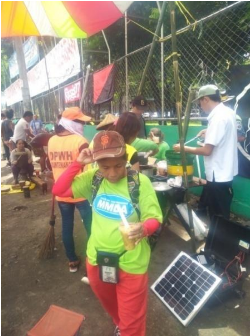
Figure 11. Street Sweeper sa Quezon City ,pagkatapos dumaan sa mesa ng Food Not Bombs