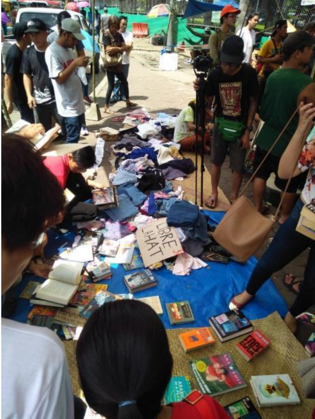
Figure 23. Isa pang halimbawa ng Free Market, SKA 2017