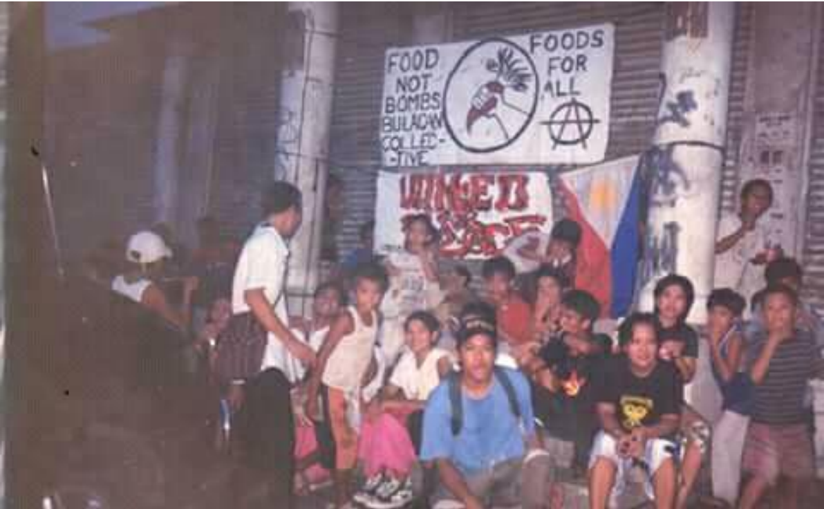
Figure 20. Lumang larawan ng mga FNB volunteers sa Guiguinto Bank sa Sapangpalay, Bulacan (5)