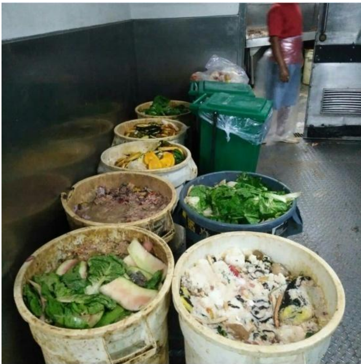
Figure 1. Maliit na bahaging pagkaing hindi nakain sa isang hotel sa Makati