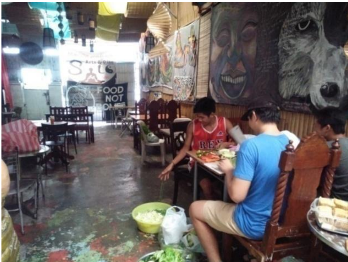
Figure 24. Paghahanda ng mga mga nakolektang gulay mula sa palengke sa Mandaluyong, July 16, 2017