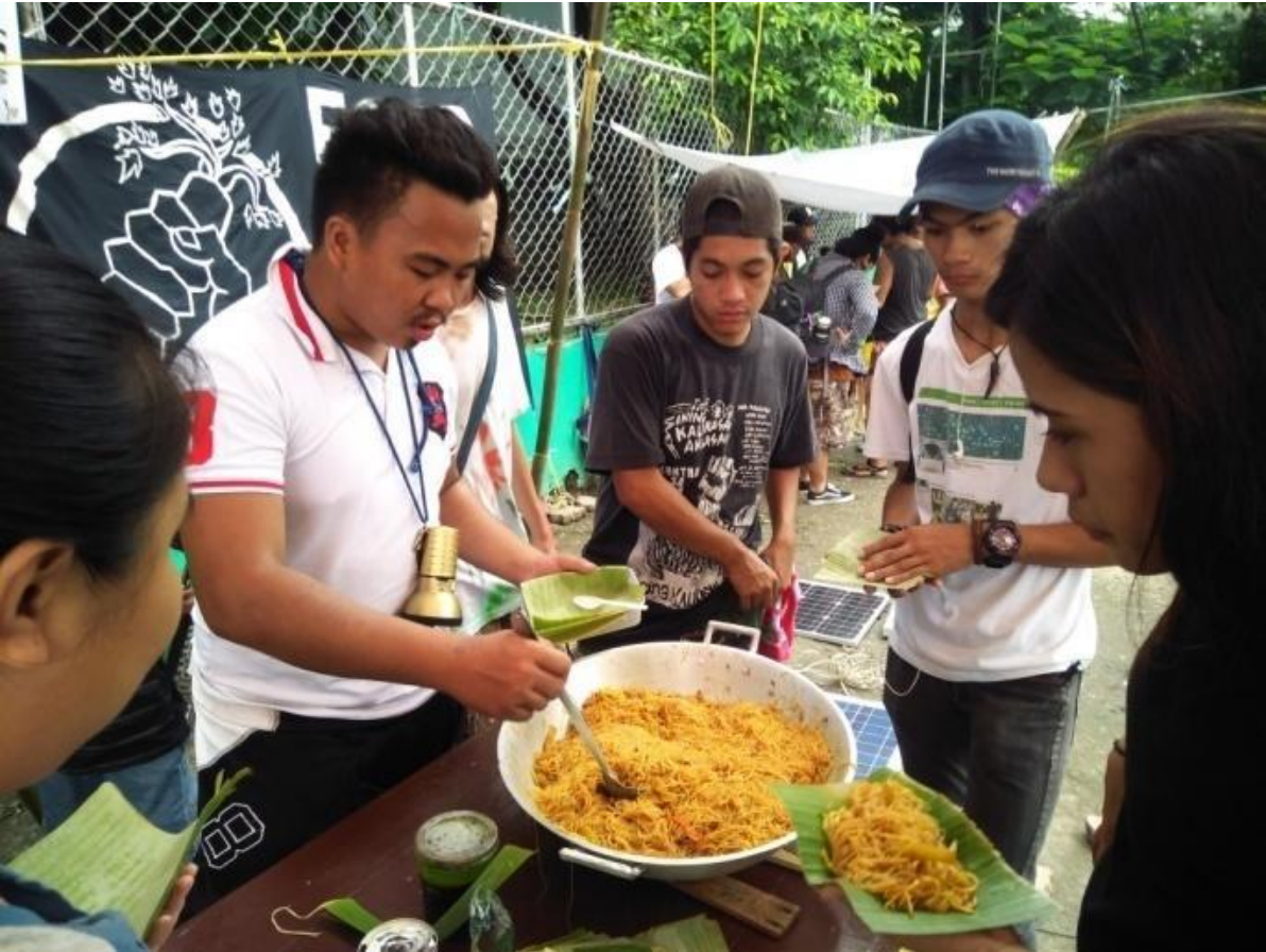
Figure 9. Food Not Bombs sa Sining Kalikasan Aklasan , Quezon City Circle, July 31, 2017