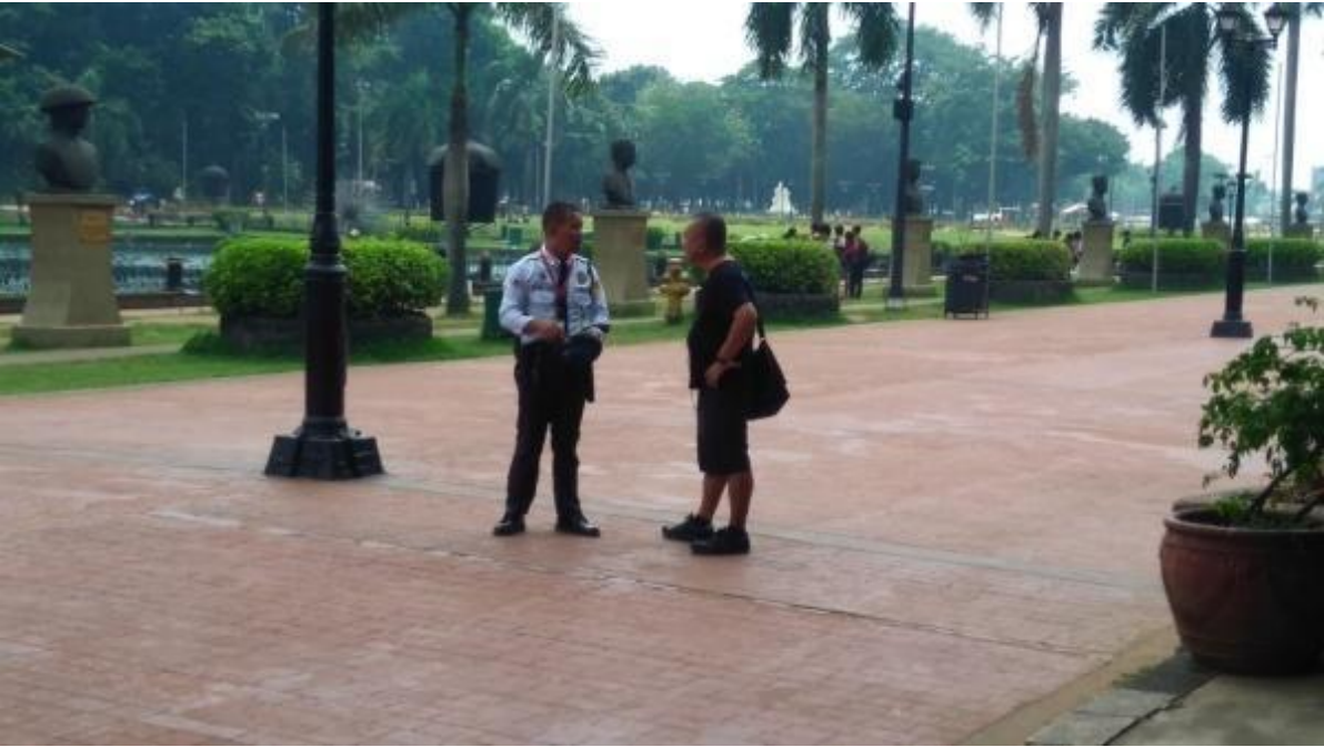
Figure 7. Estrangherong ipinagtatanggol ang FNB sa guwardiya ng Luneta Park, September 21, 2017