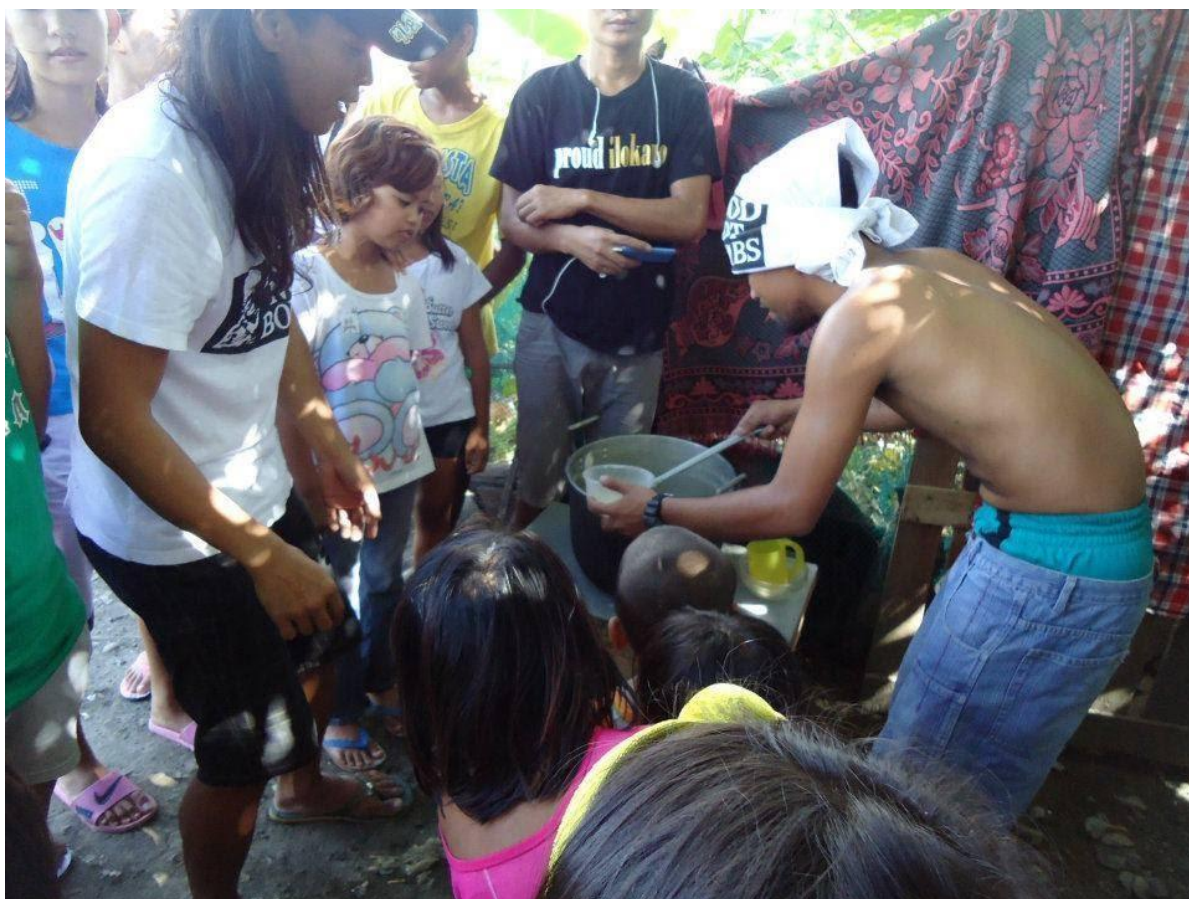
Figure 21. FNB ng Onsite Infoshop sa Muntinlupa, Manila, 2017 (6)