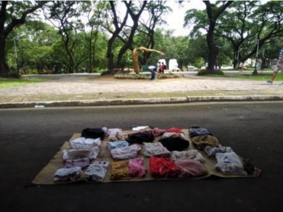
Figure 6. Halimbawa ng Free Market