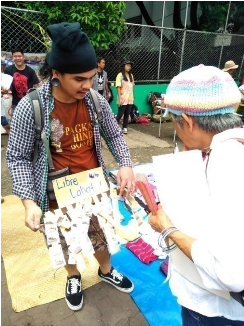
Figure 13. FNB volunteer na namamahagi ng mga buto ng gulay