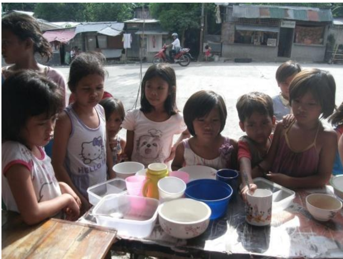
Figure 2. Mga batang naghihintay sa pagkaing ihahain ng FNB