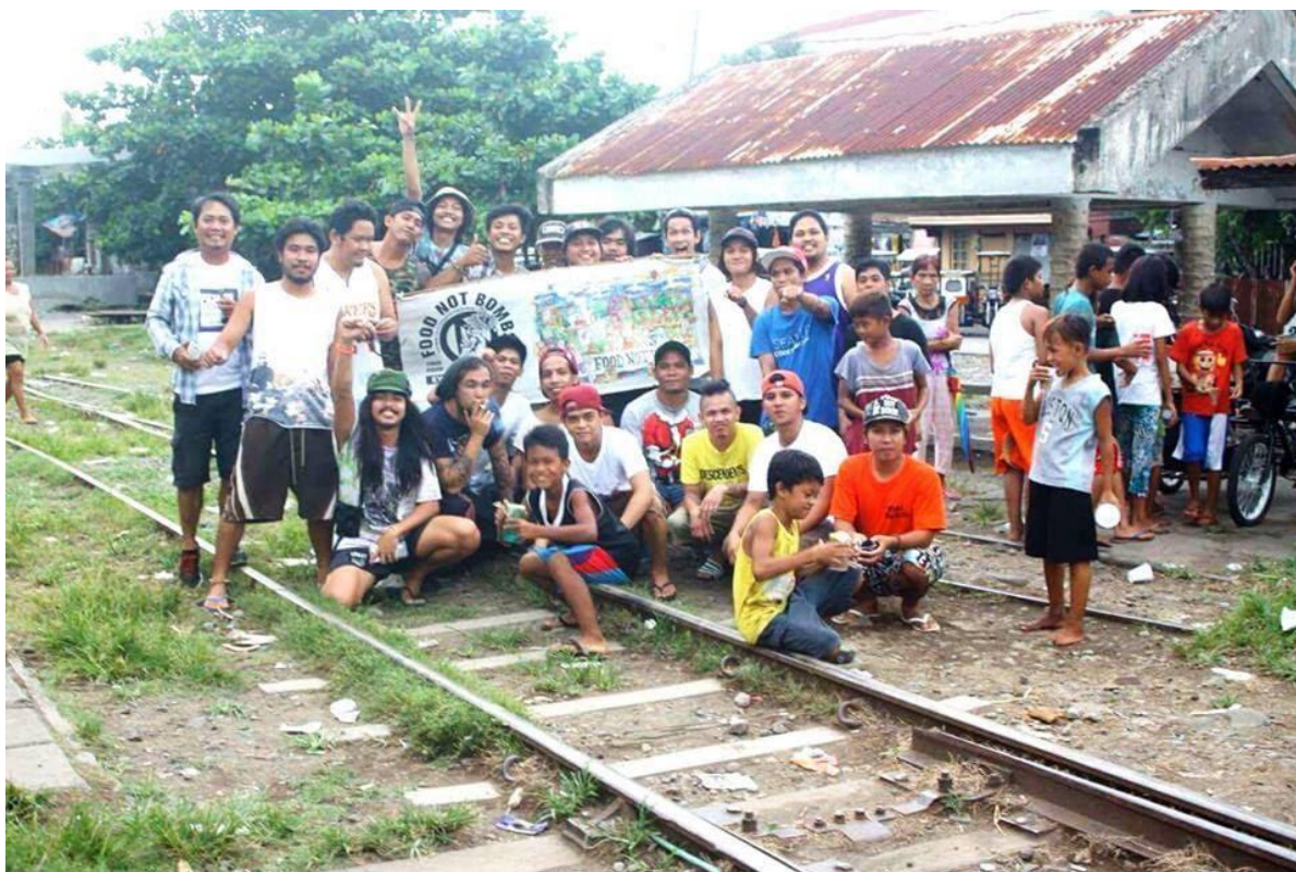
Figure 19. FNB volunteers ng Lucena at Tayabas, Quezon at Dasmaringas, Cavite sa mga riles ng Lucena, September 2016 (4)