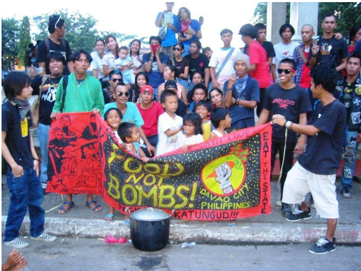
Figure 15. Food Not Bombs- Davao , 2005