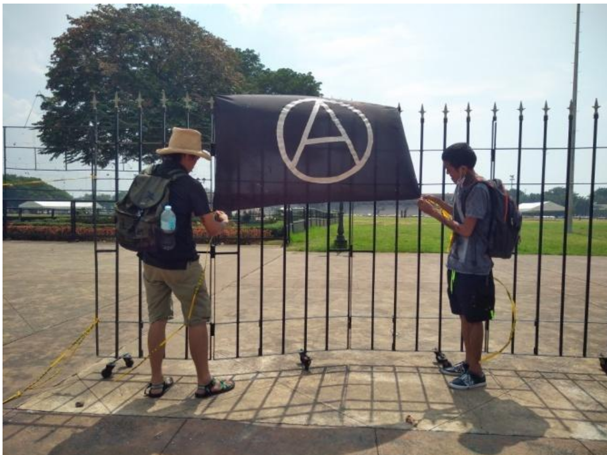
Figure 8. Mga nagpa-FNB na nagkakabit ng bandila ng Anarkismo sa Luneta Park sa Manila, September 21, 2017