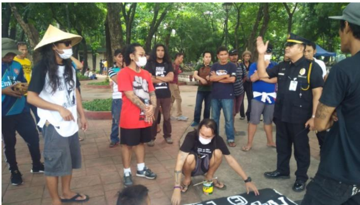
Figure 25. FNB volunteers , kaharap ang hepe sa seguridad ng Luneta Park, Semptember 21, 2017