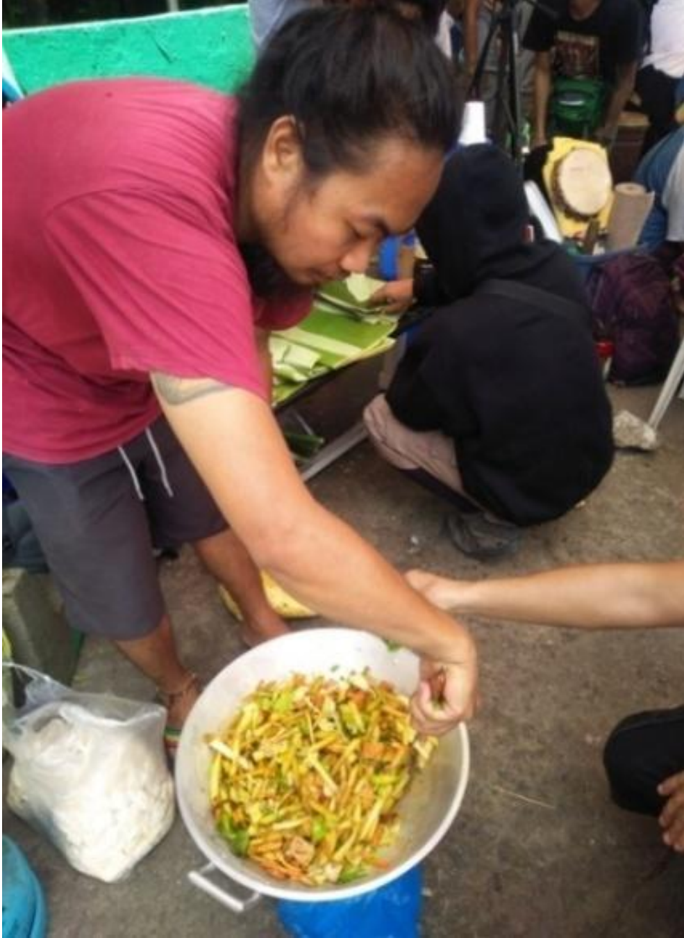
Figure 4. Pagluluto ng ipapamahaging pagkain sa Sining Kalikasan Aklasan 2017