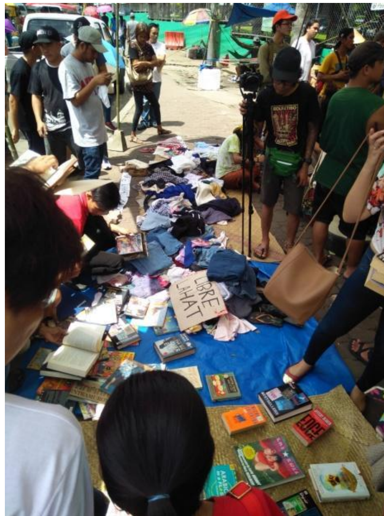
Figure 23. Isa pang halimbawa ng Free Market, SKA 2017

Sa bansa gaya ng China naging prayoridad ang pagpapatubo ng pagkain para sa livestock na binibili ng mga may-kaya. Nagbunsod ang mga ganitong gawi, ang kakulangan sa binhi para sa tao, sa