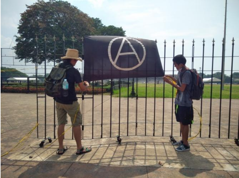
Figure 8. Mga nagpa-FNB na nagkakabit ng bandila ng Anarkismo sa Luneta Park sa Manila, September 21, 2017