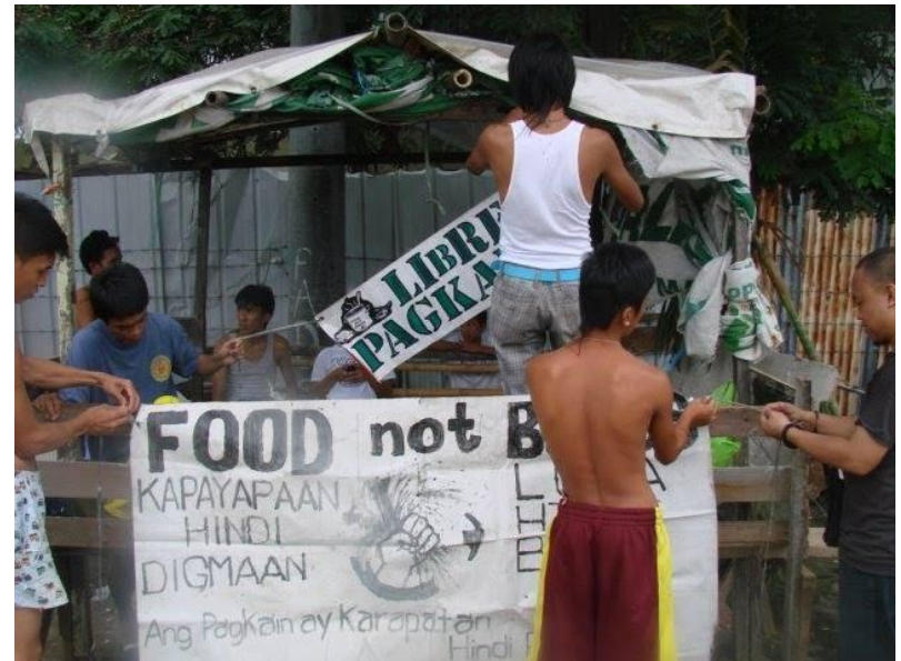
Figure 5. Mga residente na tumutulong sa pag- set-up ng Food Not Bombs sa Muntinlupa (2)