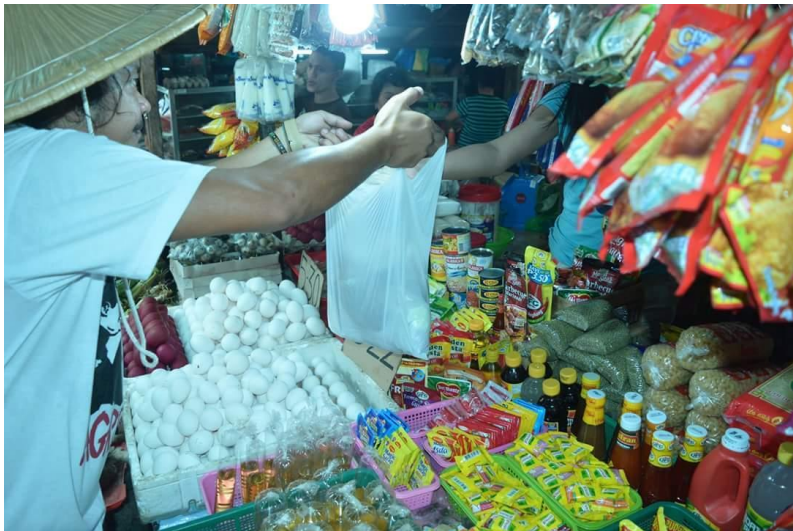
Figure 3. Pangongolekta ng mga sangkap mula sa palengke (1)