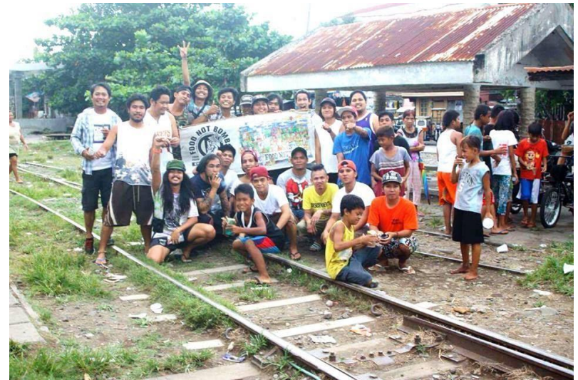
Figure 19. FNB volunteers ng Lucena at Tayabas, Quezon at Dasmariñas, Cavite sa mga riles ng Lucena, September 2016 (4)

Sa kabila ng industriyal at sistematikong pag-unlad sa proseso ng paglikha at pagbyahe ng pagkain sa buong mundo, isa sa tatlong bahagi ng pangkalahatang pagkain ang nasasayang. Sa mga “bansang umuunlad” gaya ng Pilipinas, 40% ang nasasayang na pagkain bago pa makarating sa hapag. Sa kaso ng Pilipinas, ang pinakasanhi nito ay kakulangan ng budget sa modernong teknolohiya at kaalaman, sa imprastraktura gaya ng irigasyon at maayos na daan papunta sa mga palengke, sa kakulangan ng panungkulan sa lupa, at kakulangan ng suportang pananaliksik at mga inobasyon. 14