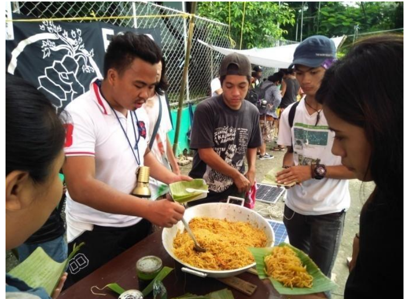
Figure 9. Food Not Bombs sa Sining Kaliksan Aklasan , Quezon City Circle, July 31, 2017

Sa Pilipinas, mainit din ang pagtangkilik ng madla sa Food Not Bombs. Ginagawa ito madalas sa mga plaza o sa mga kalyeng dinadaan ng maraming tao. Marami sa mga tumatangkilik ay iyong mga nasa ilalim ng tinatawag na lina ng kahirapan o poverty-line , o mga hindi nakakakain ng tatlong beses sa isang araw. Kabilang na dito ang mga batang palaboy at iyong mga walang tiyak na tirahan. Tinatangkilik din ito ng mga mamamayang hindi man maituturing na nagugutom ngunit nagkakaroon ng interes sa pamamaraan at adbokasiya ng Food Not Bombs. Sa mga nagsasagawa nito sa Pilipinas, hindi nagiging problema ang kakulangan sa tumatangkilik, nakikikain o nakikipagkwentuhan. Mas nararanasan pa ang problemang nagkukulang ang hinahaing pagkain.