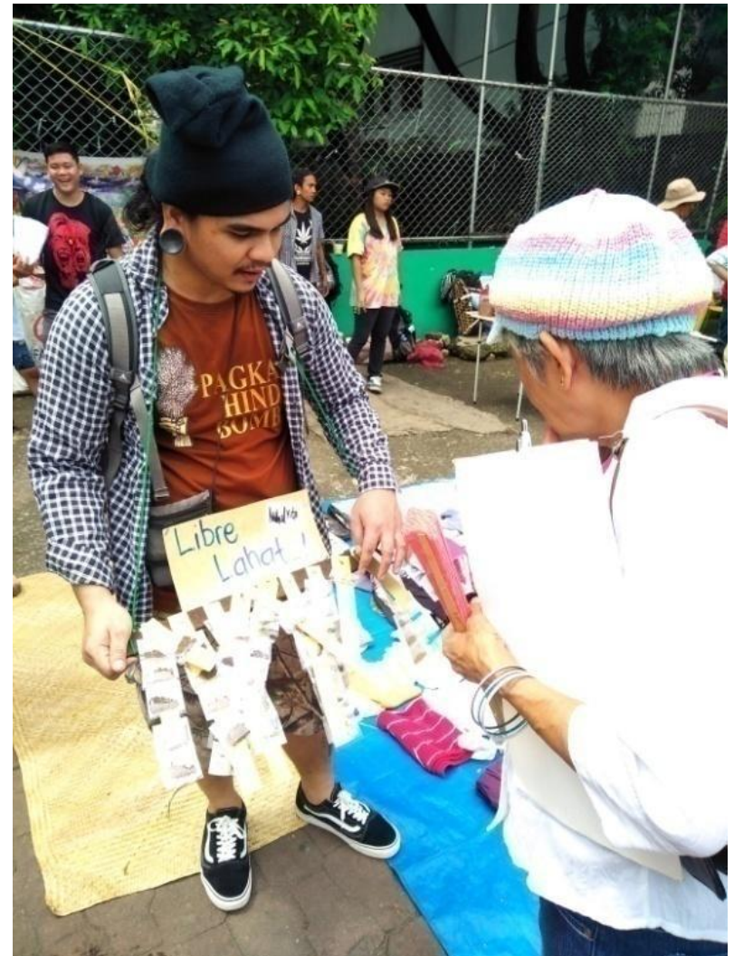
Figure 13. FNB volunteer na namamahagi ng mga buto ng gulay