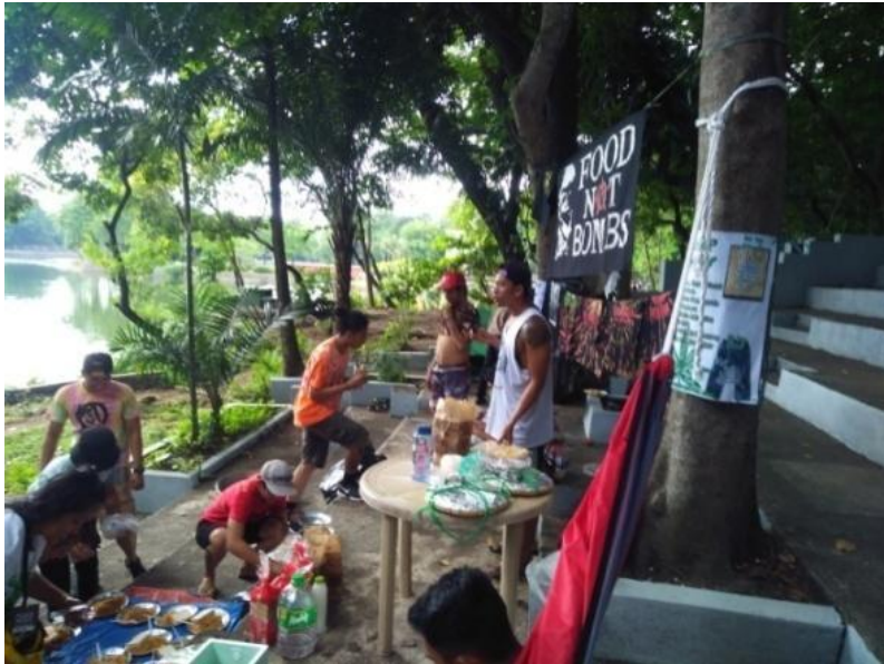
Figure 18. Lucena Food Not Bombs, nagluto para sa Global Marijuana March sa Parks 'n Wildlife, Quezon City, May 7, 2017

Tatlo sa sampung bata sa Pilipinas ang naituturing na malnourished o kulang sa sustansya. Sa kabila nito, nanatiling mas mataas ang inilaang budget para sa “Public Order and Safety” na kinabibilangan ng hukbong militar at kapulisan kaysa agrikultura. Noong 2016, P200 bilyon ang inilaan para dito kumpara sa P120 bilyon na inilaan para sa agrikultura. Malaking porsyento nito o P140 bilyon ang para sa Military. 15