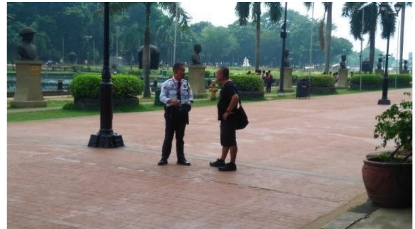
Figure 7. Estrangherong ipinagtatanggol ang FNB sa guwardiya ng Luneta Park, September 21, 2017

Isa pang pinoproblema ng ilang Food Not Bombs group ang kawalan ng lugar na paglulutuan. 19 Marahil, dahil ito sa pagiging empleyado at istudyante ng maraming boluntaryo, na pawang mga nakatira kasama ang kani-kaniyang pamilya. Ang iba ay mga Visual-Artist, guro, PUV driver, tambay, at iba pa, na pawang mga nahihirapang kumuha ng malaking espasyo na pagsasagawaan ng paghahanda.