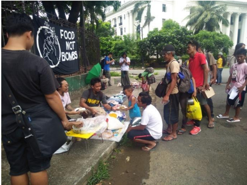
Figure 16. Food Not Bombs at Free Market sa Solidarity Against War , Luneta Park, Manila, July 16, 2017

Maiging banggitin ang mga taktikang ginagamit ng Food Not Bombs 16 para mas maintindihan ang adbokasiya nito. Sa pag-isa-isa nito, magiging mas malinaw ang larawan ng Food Not Bombs.