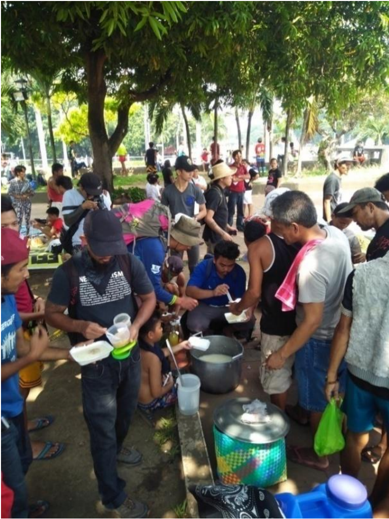
Figure 22. Food Not Bombs sa Ang Pekeng Balita ay Karahasan sa Luneta Park, Manila, September 21, 2017

pagtaas ng presyo nito. At dahil sa pagtaas ng presyo ng pagkain sa mga bansang may mataas na bilang ng maituturing na mahihirap, tumaas lalo ang bilang ng mga nagugutom.