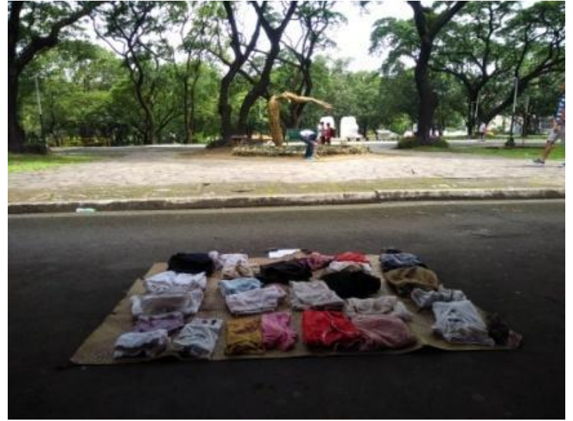
Figure 6. Halimbawa ng Free Market