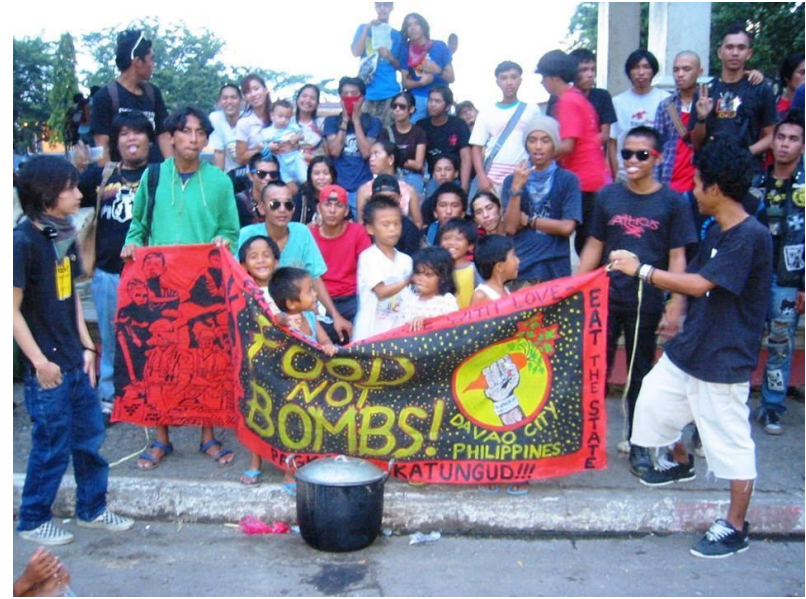
Figure 15. Food Not Bombs- Davao , 2005