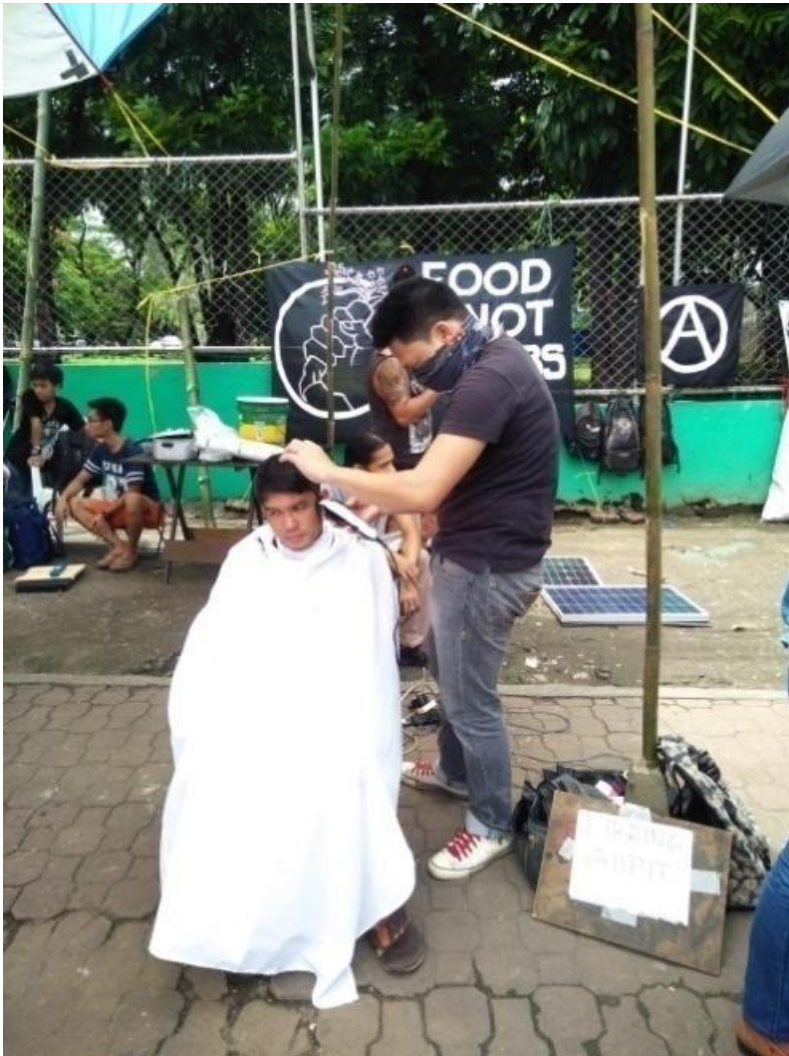
Figure 12. Volunteer ng FNB na nagbibigay din ng libreng gupit

Sa obserbasyon sa mga bersyon ng Food Not Bombs sa kapuluan, karamihan kung di man lahat ng taktikang ito ay isinasagawa. Halimbawa, may pagkakataong bumibili ang mga organisador ng mga sangkap imbes na humingi. May mga chapter ng Food Not Bombs dito na nananatili sa isang lugar gaya ng FNB Baliuag Bulacan na linggu-linggong nasa simbahan ng Baliuag. Samantala, ang mga nagsasagawa ng FNB sa Manila ay madalas na lumipat-lipat ng lugar para ma-serbisyuhan ang mas marami at iba-ibang tao.