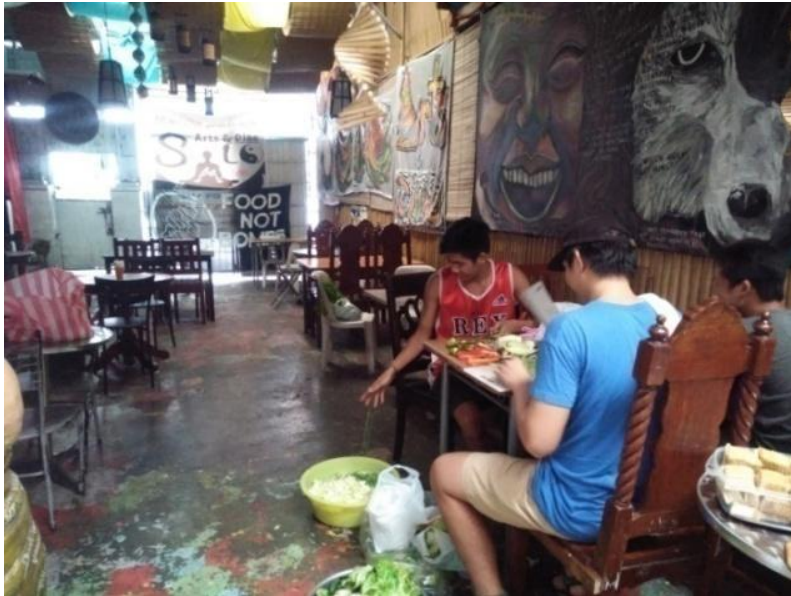
Figure 24. Paghahanda ng mga mga nakolektang gulay mula sa palengke sa Mandaluyong, July 16, 2017

Nagbunsod pa ito ng mas maraming pag-aresto nang magkaroon ng mga protesta bilang pagtuligsa sa naunang mga pag-aresto. Nabalita ito sa CNN, New York Times at London Times. Paglipas ng ilang araw, nagbigay ng pahayag ang mga pulis at sinabing pwede lamang gawin ang pamamahagi ng pagkain “sa gitna ng karagatan”. Ayon sa kanila, hindi ito maaaring gawin sa mga pampublikong lugar. Dagdag pa ng kapulisan, “Nagsasagawa lang kasi sila ng politikal na pamamahayag at hindi iyon pinapayagan.” 4