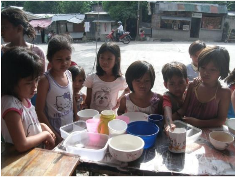
Figure 2. Mga batang naghihintay sa pagkaing ihahain ng FNB