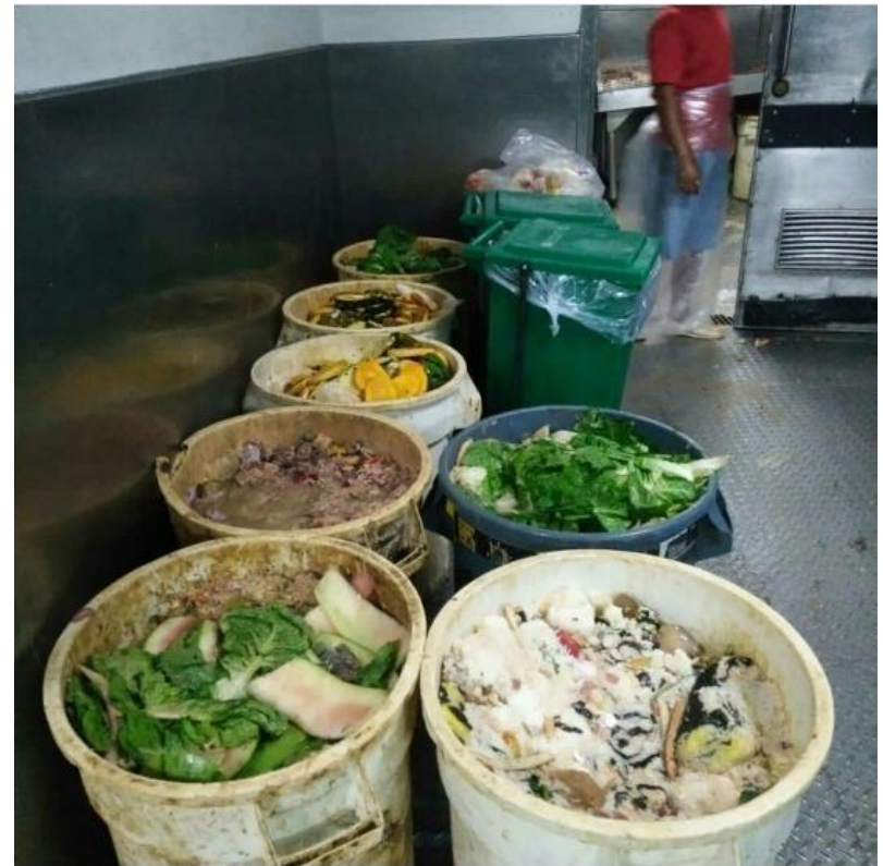
Figure 1. Maliit na bahaging pagkaing hindi nakain sa isang hotel sa Makati