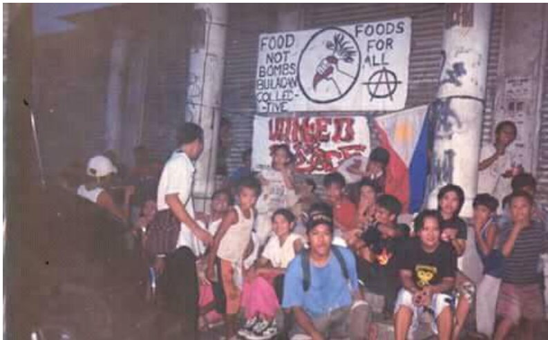
Figure 20. Lumang larawan ng mga FNB volunteers sa Guiguinto Bank sa Sapangpalay, Bulacan (5)