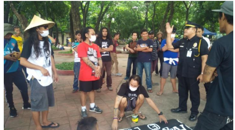
Figure 25. FNB volunteers , kaharap ang hepe sa seguridad ng Luneta Park, Semptember 21, 2017

Lalong naging matunog ang Food Not Bombs nang sumama na ito at naghanda ng pagkain para sa mga sunod pang protesta. Lalo pa noong magsimula ang mga pag-aaresto sa kanila dahil sa pagbabahagi nila ng pagkain. Isa sa mga mahalagang tagpo ay nang arestuhin ang siyam na tao dahil sa pamamahagi ng pagkain sa Haight Ashbury Park noong August 1988. May 45 na Riot Police ang lumitaw mula sa kakahuyan at inaresto ang siyam sa namamahagi ng pagkain.