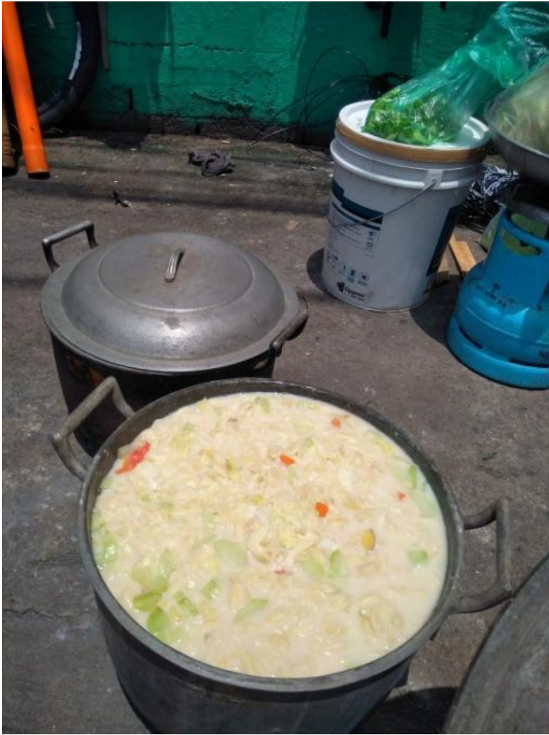
Figure 10. Libreng sopas para sa mga dumadaan sa Sining Kaliksan Aklasan, 2017