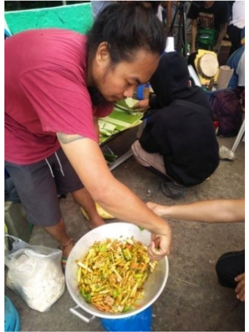
Figure 4. Pagluluto ng ipapamahaging pagkain sa Sining Kalikasan Aklasan 2017