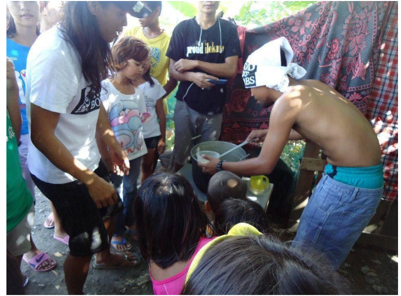
Figure 21. FNB ng Onsite Infoshop sa Muntinlupa, Manila, 2017 (6)