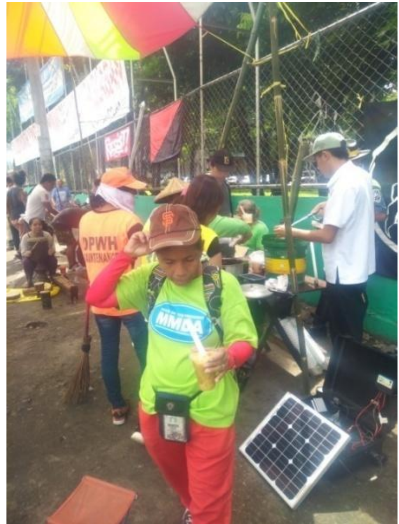
Figure 11. Street Sweeper sa Quezon City ,pagkatapos dumaaan sa mesa ng Food Not Bombs

Sa Pilipinas, ilan sa mga grupo ng Food Not Bombs ay nakita at makikita sa mga lugar gaya ng Manila, Rizal, Bulacan, Laguna, Cavite, Quezon, Cebu, Bicol, Pangasinan, Tarlac, Baguio, Negros, Cagayan De Oro, Gen. Santos, Iligan at Davao 1 . Sa bahaging ito, bibigyang-pansin ang reaksyon ng (1) madlang binabahaginan ng Food Not Bombs,(2) ang tugon ng mga awtoridad, at (3)ang naging epekto ng kilusang ito sa mismong mga boluntaryong nagsasagawa nito na kinapanayam.